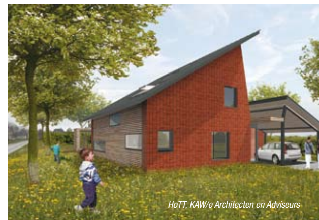
HoTT, KAW/e Architecten en Adviseurs